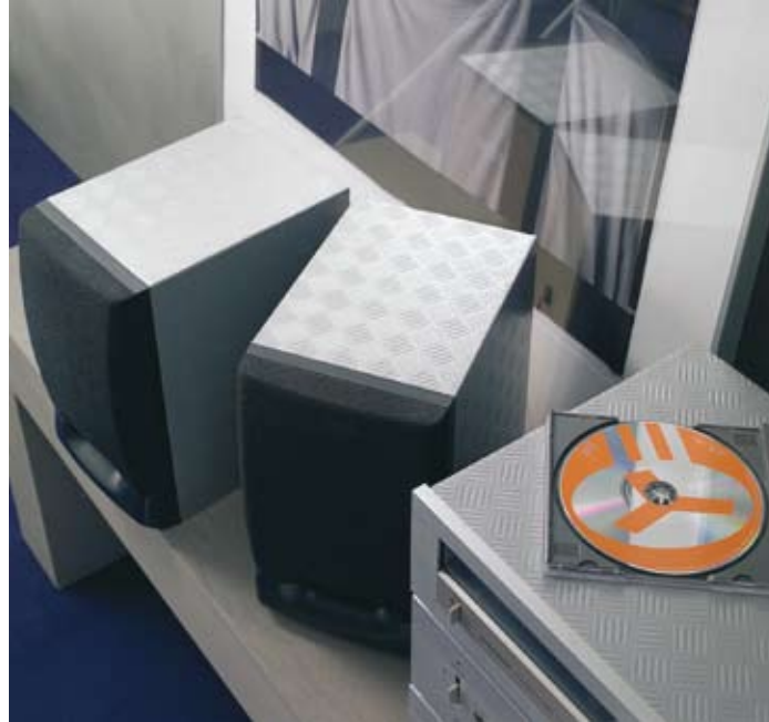
Für Trendsetter Im aktuelle Look mit Metallic- und Wildlife-Folien

Mit unseren Metallic- und Wildlife-Folie entsteht schnell eine trendige Atmosphäre, in der es sich nicht nur gut Musik machen lässt. Im Handumdrehen erhalten nicht nur Boxen oder Regale ein neues Design. Ihre Kreativität passend zu den aktuellen Mode- und Design-Trends.