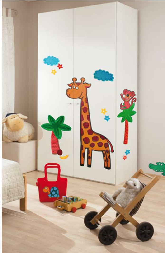
SPiRiT Neu und kreative dekorieren

Wenig Aufwand und große Wirkung: das ist deco spirit. Die selbstklebenden Elemente bringen trendiges Design in jeden Raum. Einfach aufzubringen und wieder abzulösen. Im Nu ein frisches Styling für jeden Raum.