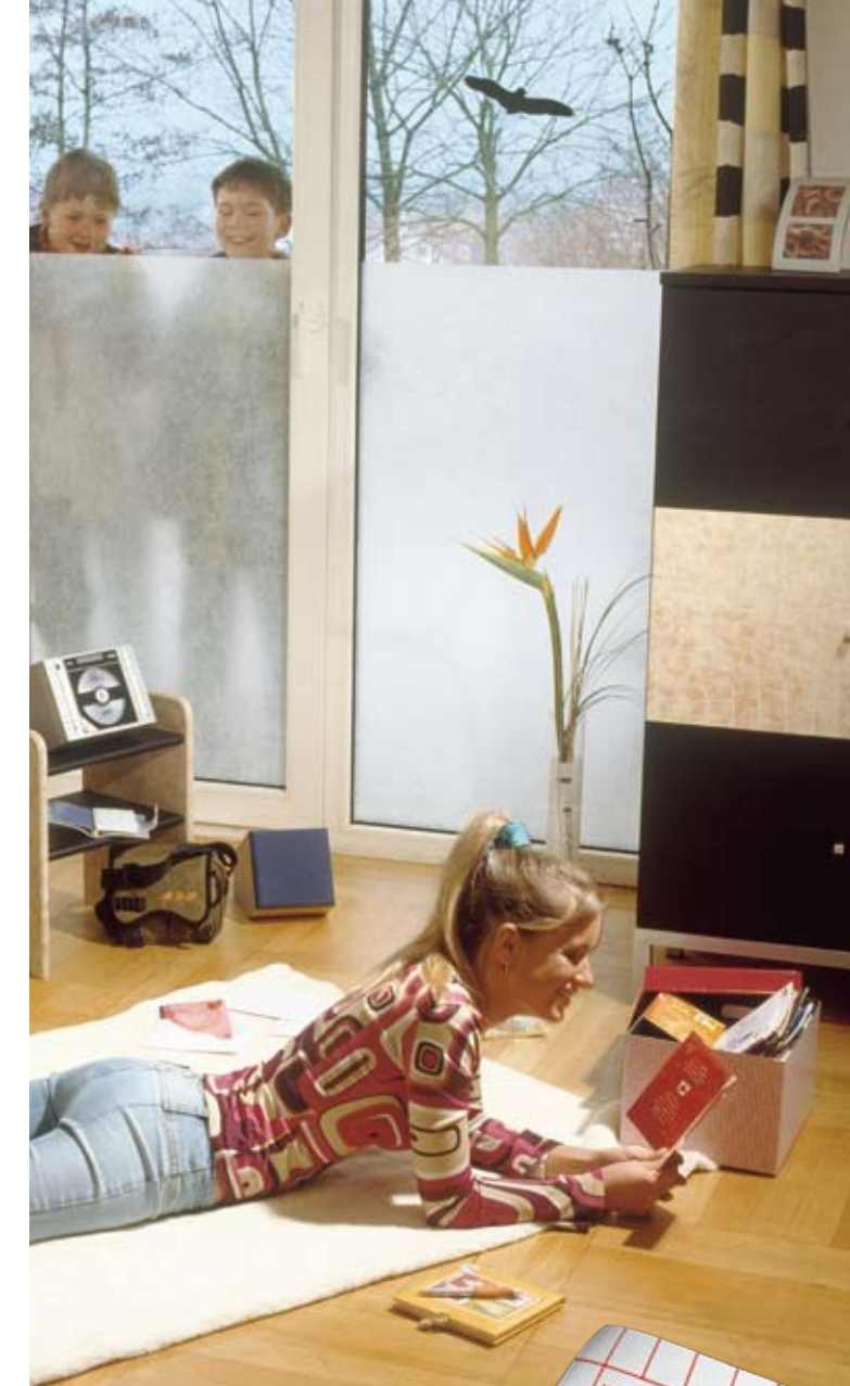
Blickfang mit großer Wirkung Sichtschutz mit Transparentfolien