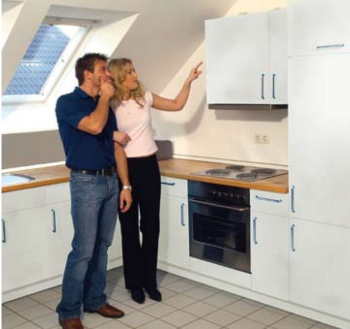
Einfach perfekt. Die Holz- und Marmor-Folien

Das Rezept für echte „Gourmets“: Eine Kombination aus Holz und Marmor. Die Wirkung ist verblüffend: Alte Arbeitsflächen, Fronten und sogar der Kühlschrank werden wie neu. So wird die Küche ohne großen Aufwand zum Lieblingsraum – und das Kochen bereitet noch mehr Freude.