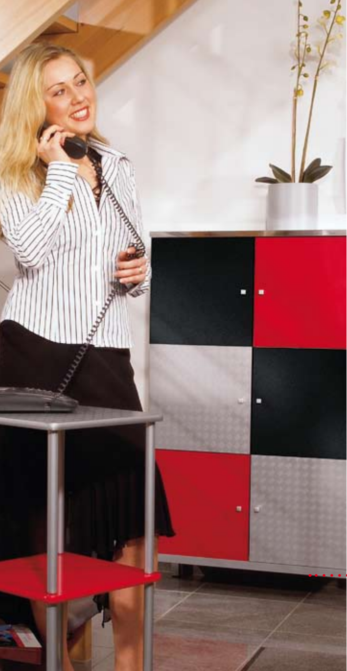
Das Plus für Ihre Stimmung Akzente setzen mit Uni- und Effekt-Folien

Alltag raus – Stimmung rein! Zum Beispiel mit Spiegelfolie oder Uni gelingt es jedem, langweilige Möbel neu zu gestalten und mehr Farbe in die Wohnung zu bringen – sogar in kürzester Zeit.